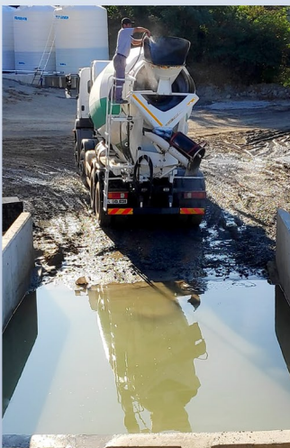
Resim-1. Yıkanan beton mikserinden gelen çamurlu su.