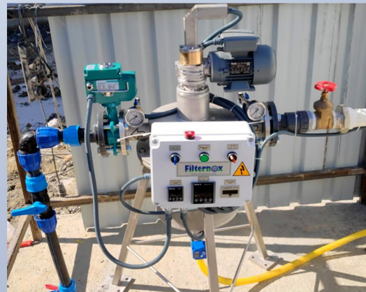
Resim-2. Sahada kurulu Filternox Filtre.